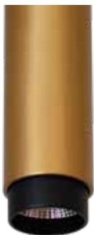
Notary XL Zoom 35°-45°

Luminaria Notary XL fabricada en tubo de aluminio Ø 58mm, acabado con pintura electrostática en color negro (otros bajo pedido), distribución de la luz puntual, ángulos de 24° y 36° (Notary XL), 17°, 26°, 45° y 60° (Postóptica) y Zoom desde 35° hasta 45° de apertura. Apta para uso interior, grado de hermeticidad IP20, flujo lumínico de 1140 lúmenes, potencia de 13 W (potencia con pérdidas del driver incluidas). Eficacia de 87.7 Lm/W, temperatura de color desde 3000K hasta 5000K e IRC 90% (otros bajo pedido), vida útil de la fuente de 50.000 horas en L70B50 a 85 grados de temperatura en el TC, 3 en el Step MacAdam. La luminaria cuenta con Driver multivoltaje, programable, con un factor de driver entre 0.84 y 0.86 a 120V, con protección de sobrevoltajes, protección contra transistores ANSI C62.41 Cat. A 2.5 kV, protección térmica interna, dimerización de 0-10V (DALI opcional), temperatura de trabajo desde -20 hasta 25 grados centígrados.